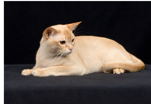
Röd vuxen hane