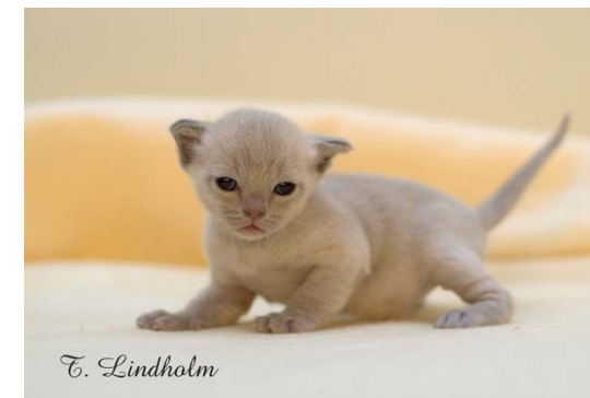
Lila kattunge, hona